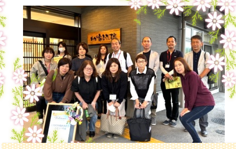
滋賀県小規模多機能型居宅介護事業者連絡会主催の視察交流会でお越しいただいた皆様