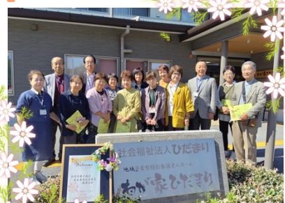
敦賀市民生委員の皆様