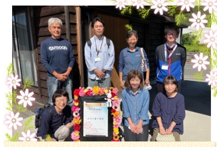
社会福祉法人滋賀県聴覚障害者福祉協会 湖北みみの里の皆様